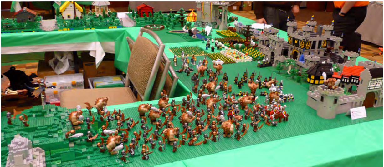
Arriba; Dos vistas del diorama del LEGO® North Illinois Train Club. Uno de nuestros favoritos