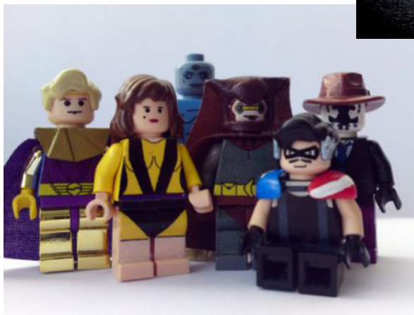
Watchmen por burakki62