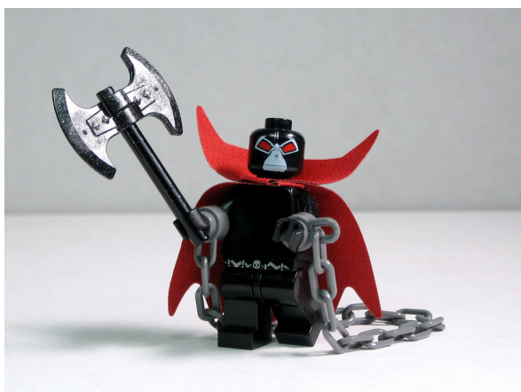
Spawn por Dunechaser