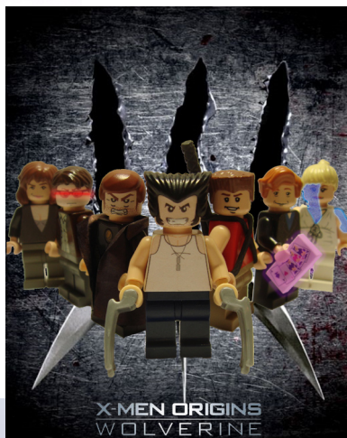
Lobezno por tin7