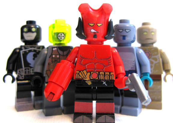
Hellboy por Sir Nadroj