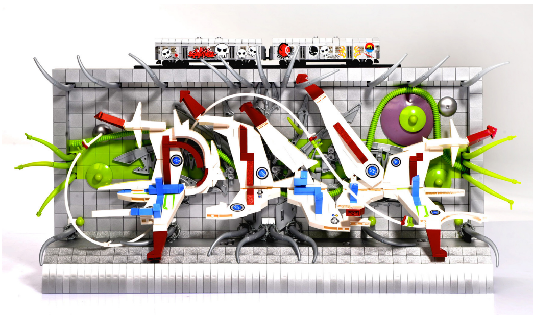
"PAX NYC Style" by Orion Pax

En realidad, a mi ni siquiera me importa, mientras la creación se vea bien si está pegada, cortada, doblada, flameada a la parrilla, desnuda o enviada ida y vuelta a la luna ;) #