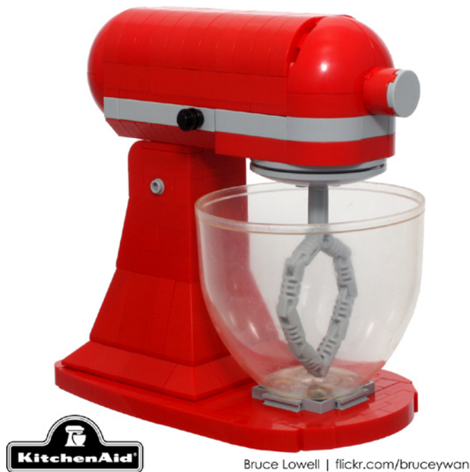
Bruce Lowell | flickr.com/bruceywan

BL: Tengo una gran admiración y cariño por la belleza del LEGO® de los 80 y anterior, considerando el limitado número de piezas y colores disponibles en aquel momento. Pero puede que parte sea nostalgia de mi infancia. El aumento de la paleta de colores, la transición de las piezas de ángulos rectos y con studs a curvas y sin studs, y la cantidad de piezas disponibles han hecho la construcción más fluida y realista.