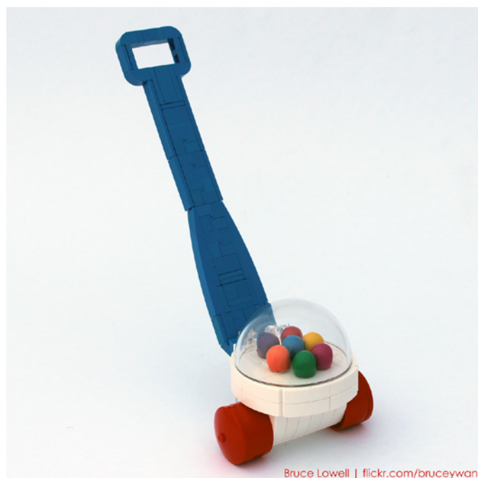
Bruce Lowell | flickr.com/bruceywan

BL: Me gusta el desafío de construir dentro del marco que LEGO nos da, por lo que me mantengo alejado de elementos no oficiales como regla. Ocasionalmente si un MOC o trabajo encargado la necesita, creo una pegatina o uso ladrillos grabados, pero cuando lo hago me gusta hacerlo lo mínimo posible y usarlas del modo en que creo que LEGO las usaría si estuviera construyendo lo que yo construyo.