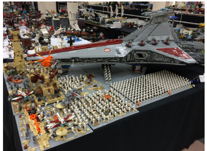
"Zombie Apocalypse en Geonosis", por Rich Maes