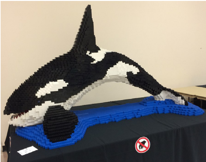
Blackberry, la orca LEGO gigante, por Robin Sather

BrickCon 2014 regresó al Seattle Center, en Seattle, Washington, por 13er año. Este año se presentaron 470 asistentes a la convención con sus modelos de diferentes formas y tamaños, desde Space Needles gigantes y orcas DUPLO, a las pequeñitas-minúsculas réplicas de modelos reales para el display micro-BrickCon.