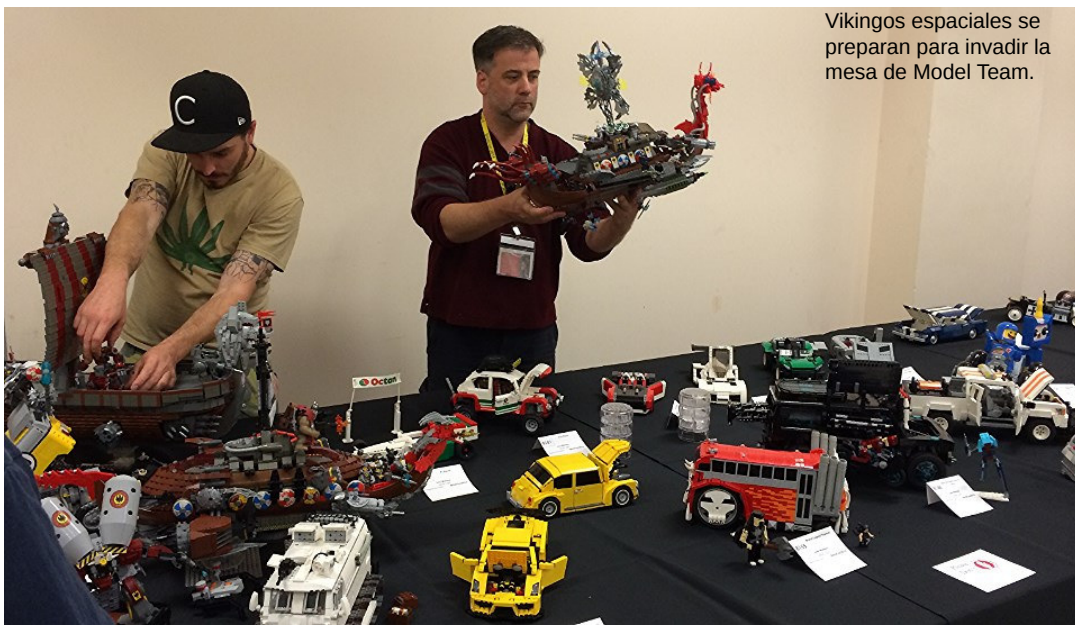
Vikingos espaciales se preparan para invadir la mesa de Model Team.

Algunas de las invasiones eran muy creativas en su alcance y ámbito de aplicación. Los temibles Vikingos del espacio (junto a sus respectivos constructores) invadieron más de un tema en el transcurso de la convención. Llevando sombreros vikingos y con música de batalla, el grupo de constructores agarró sus naves espaciales vikingas para ir a conquistar el display de vehículos de Model Team.