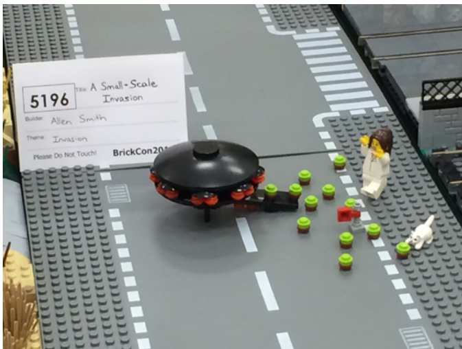
"A Small-Scale Invasión", por Allen Smith

A diferencia de las batallas a gran escala emprendidas a lo largo de la sala de exposiciones, había también unas cuantas invasiones pequeñas. En "A Small-Scale Invasion" por Allen Smith, los invasores no son más grandes que los ratones, para el deleite de los gatos del barrio. Y a veces, la fuerza invasora podría ser algo tan lindo y tierno como una oveja de viaje de placer en el modelo de otra persona, como fue el caso de las ovejas de Thorin Finch apareciendo en todo tipo de diferentes lugares, como en el "Sun Salamander" por Sean y Steph Mayo.