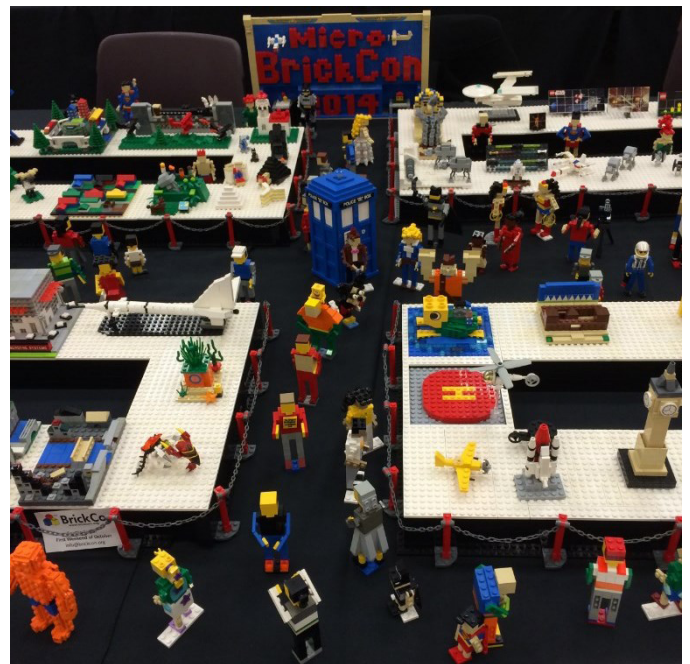
"Micro BrickCon", por distintos constructores

El tema de la convención de este año fue "¡Invasión!" Muchos de los modelos expuestos contaron con algún tipo de invasión, desde las ortodoxas a las más creativas e inteligentes. Algunas de las invasiones ofrecían una extraña mezcla de diferentes temas, como por ejemplo una invasión extraterrestre de un castillo medieval, espeluznantemente retratado por Andrew Schultz. También hubo una invasión de zombies en el mundo Star Wars de Geonosis, según lo retratado por Rich Maes. Y en el modelo "Sandbox", por el LEGO® Club de Vancouver ( http://lc.ca/ ), un área de juegos infantiles se convierte en una batalla que se libra entre soldados de juguete y hordas de insectos invasores.