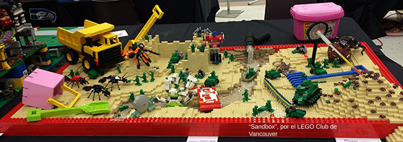
"Sandbox", por el LEGO Club de Vancouver