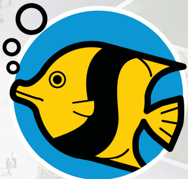
Icono definitivo "Fish"