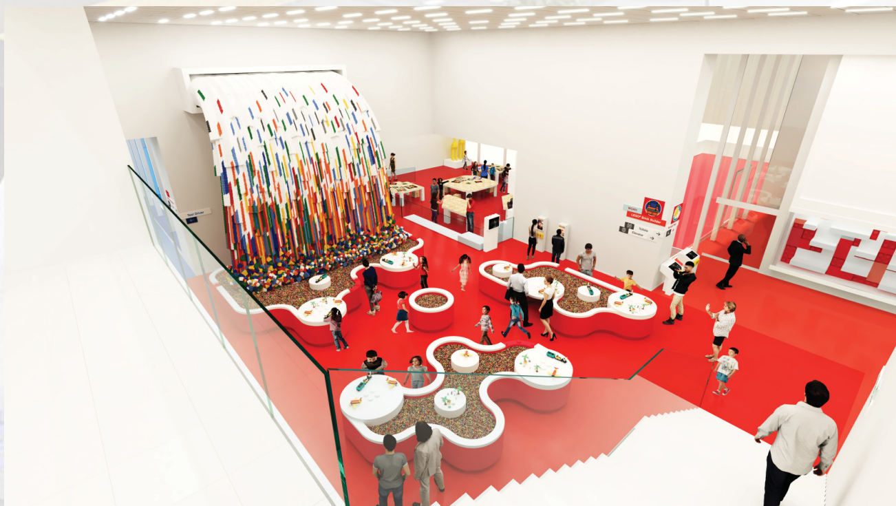
Zona Roja (Simulación)