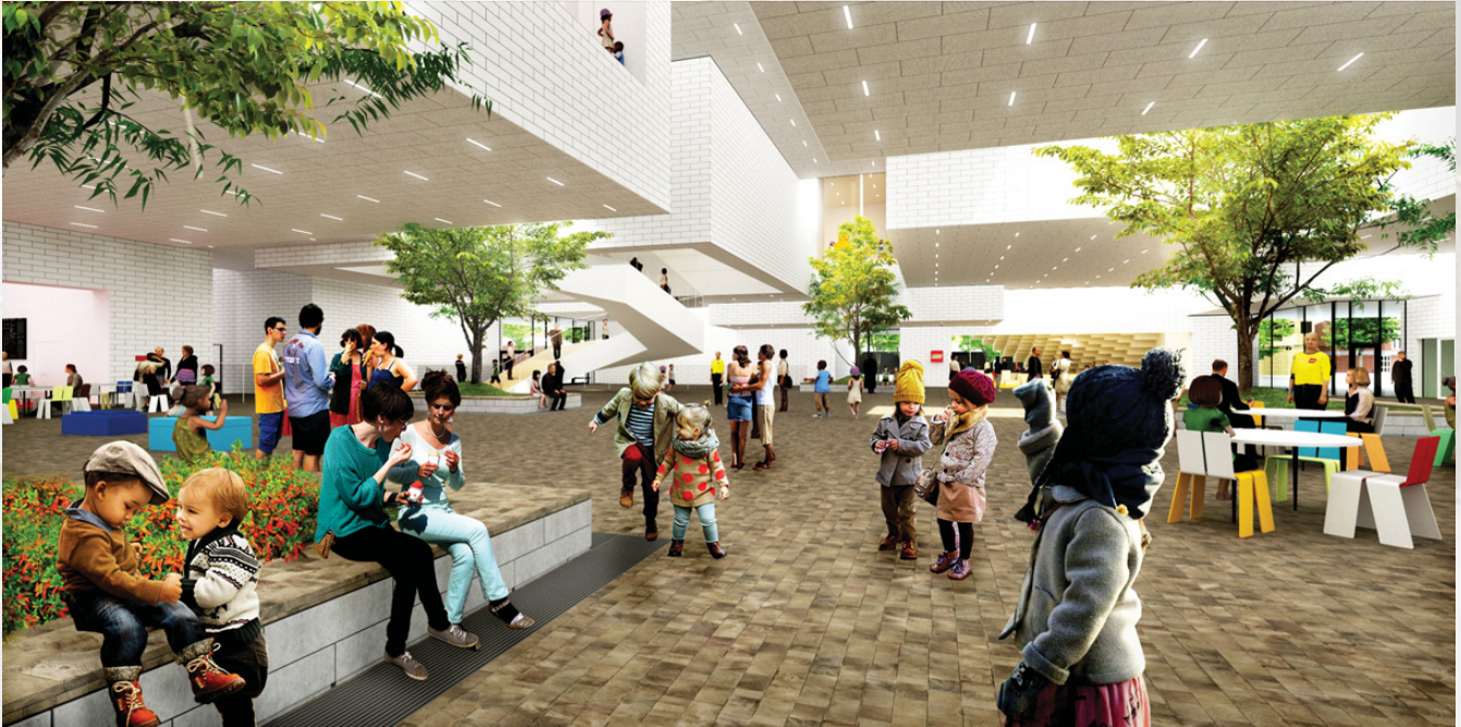
Plaza LEGO® (Simulación)

Entramos a los que será la plaza principal, desde donde se puede observar el edificio “desde dentro”. Esa plaza será un lugar público donde se podrá comprar las entradas y acceder al recinto, pero también pasear, comprar en la tienda o comer en el restaurante sin adquirir una entrada. Evidentemente todo tiene las proporciones del ladrillo (a una escala superior). Ha he comentado que el exterior del edificio simula estar construido con ladrillos 2x4, pero por ejemplo, el suelo de la plaza principal parece estar construido con baldosas 2x2, y así todo el resto de elementos.