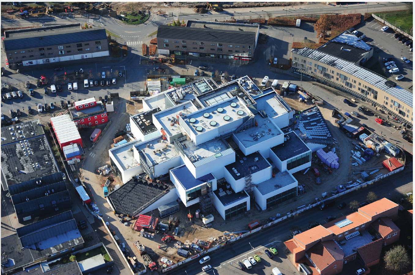
Obras de la LEGO® House