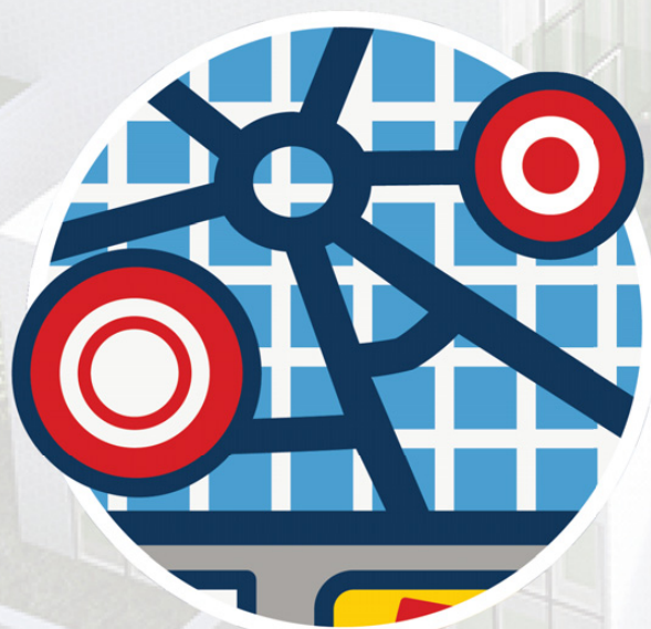
Icono definitivo "City Architect"

No "solo" se utilizó la opinión de los AFOLs en este apartado. Por ejemplo, hace un tiempo LEGO solicitó ideas para el nombre de los restaurantes del edificio. Uno de ellos se llamará "Brickaccino", nombre propuesto por la Comunidad. Se barajaron nombres propuestos por la Comunidad para los otros dos restaurantes, pero finalmente tendrán nombres de carácter más comercial y que permitan diferenciar cada uno de ellos.