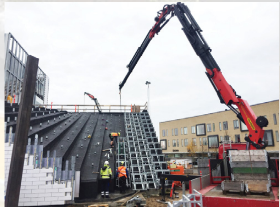
Evolución de la construcción, donde se observan las baldosas

En la charla que tuve con Gitte Nipper descubrí hasta qué punto está presente la “obsesión” de que absolutamente todo tenga relación con el Sistema LEGO. Toda la señalética tiene proporciones de distintos ladrillos LEGO, y los colores están basados en el pantone utilizado en los ladrillos. Se utilizan los colores básicos (Azul, Rojo, Amarillo y verde), junto con el negro y blanco. Hay algunas diferencias de tonalidad (más oscuro y más claro) para permitir distinguir algunos elementos dentro de los colores principales. Además se han elegido algunos colores secundarios que sirven de contraste para los colores principales.