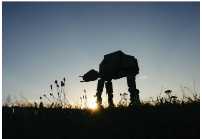
The Morning After