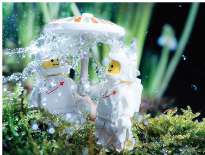
Planet Spring por MeZ

Mike y Vesa no son los únicos que han convertido el stormtrooper en su musa. Kristina comenzó un proyecto 365 (es decir, publicar una imagen al día en medios sociales durante un año – un reto creativo popular entre fotógrafos de juguetes) en 2011 que giraba en torno a una familia de stormtroopers y eso atrajo bastante atención en los medios. Su 'familia' plástica consistía de una figura de acción de stormtrooper tradicional junto con una versión más pequeña de LEGO, participando en actividades cotidianas. La cantidad de emoción que consigue proyectar con dos pequeñas piezas de plástico es de lo que se trata e la fotografía de juguetes: la capacidad de hacer partícipe a la audiencia y provocar una respuesta emocional.