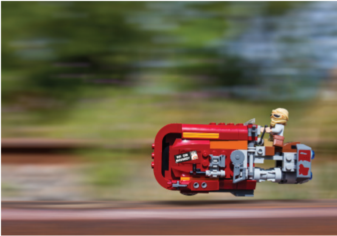
Rey's Speeder por Ballou34