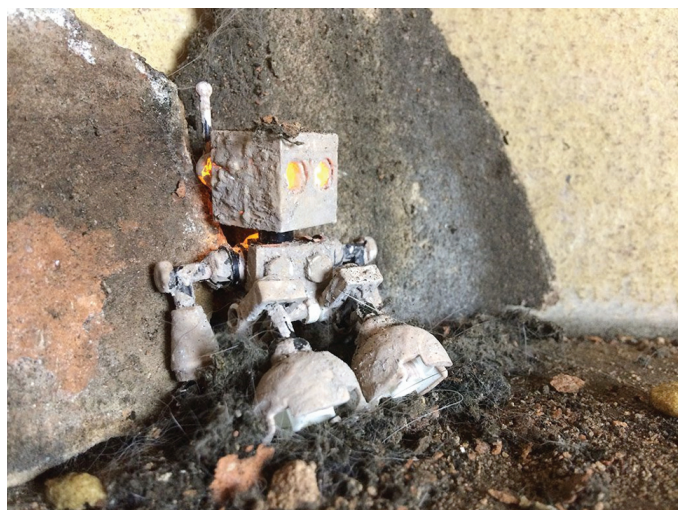
El último proyecto creativo de Mike incluía un robot de LEGO

Mike fue decisivo en la promoción de la fotografía con LEGO® en los primeros tiempos. En 2008 su serie de imágenes