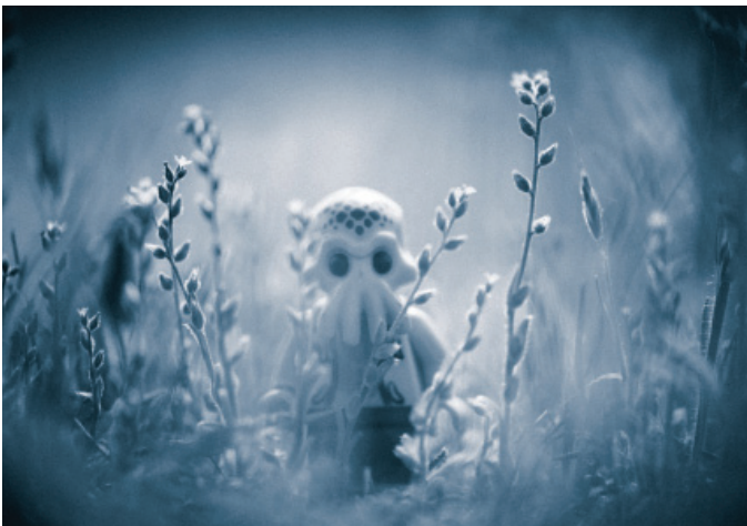
Alien por Me2