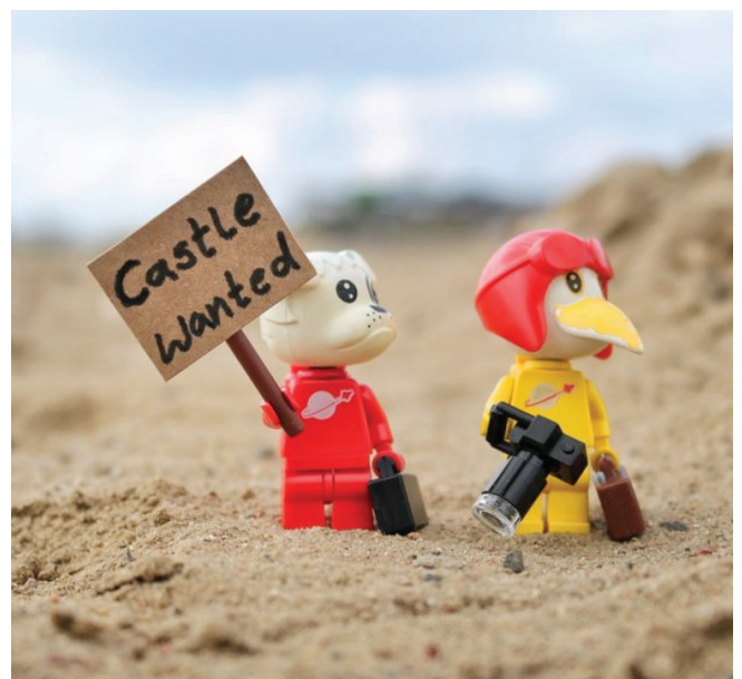
¿Quieres unirte a nosotros en Escocia? ¡Es gratis y muy divertido!