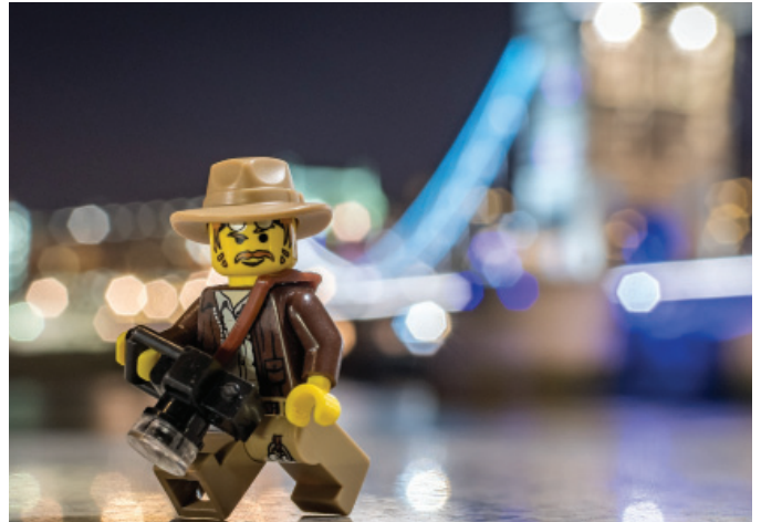
London por Reiterlied