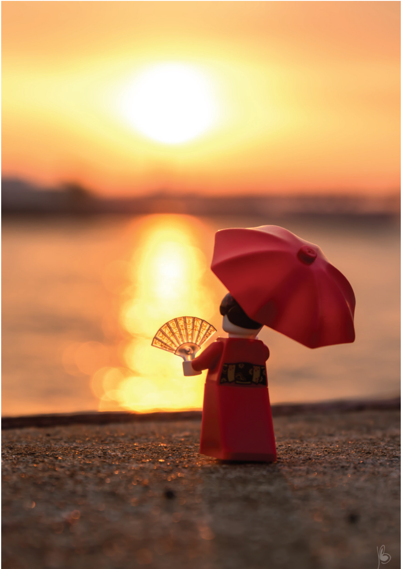
Kimono girl at sunrise