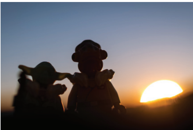
To The Lofoten Islands and Back Again por Reiterlied