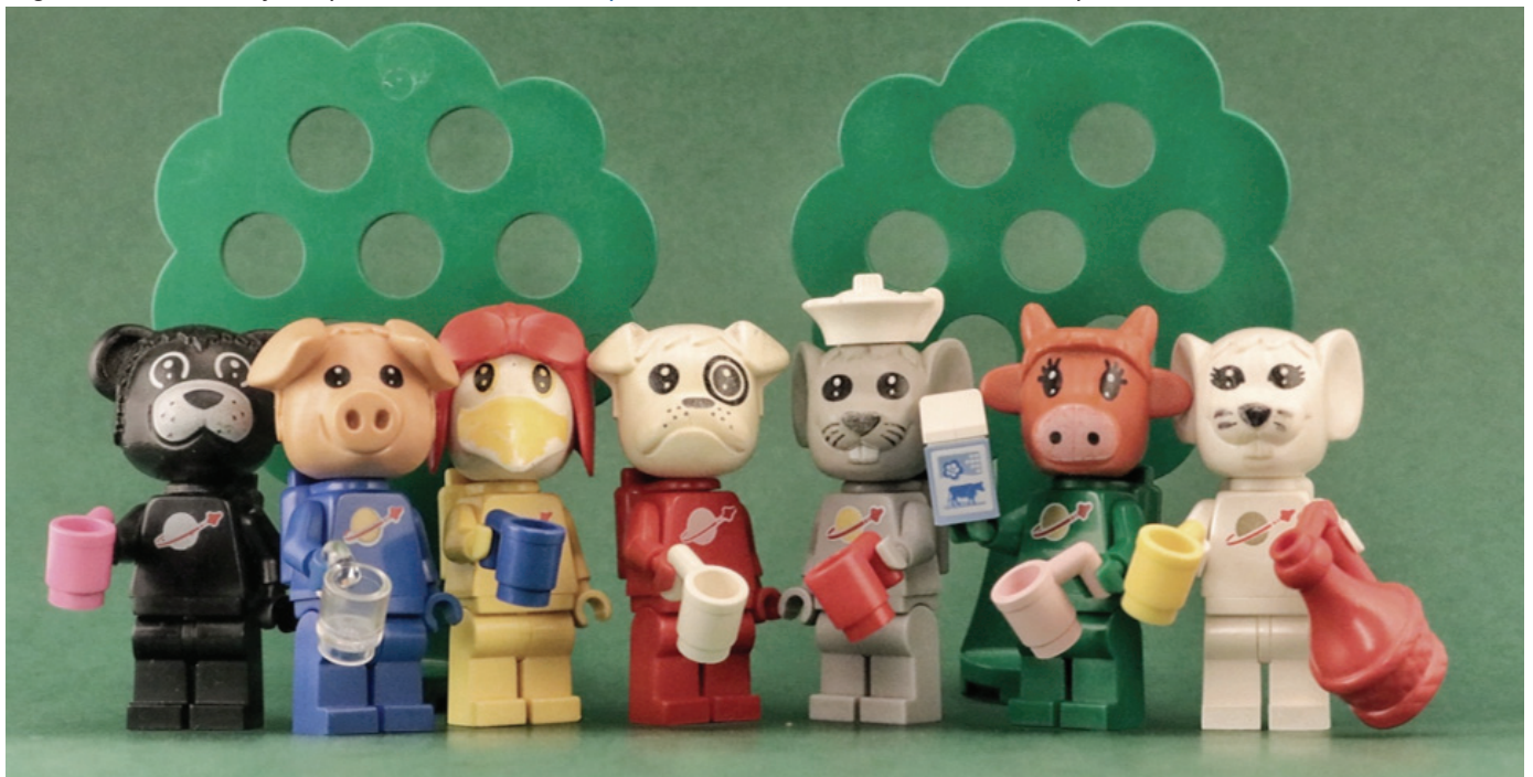
After Work por HerrSM

Síguenos en nuestro viaje de plástico en www.stuckinplastic.com o medios sociales @stuckinplastic.