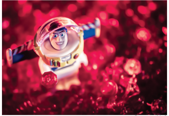
Buzz por Me2