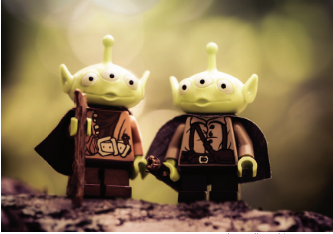
The Fellowship por Me2