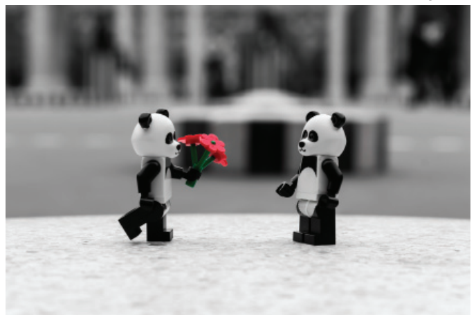
Panda Love por Ballou34