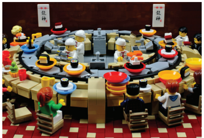
"Itadakimasu!" construido para "Iron Builder"

CF: He participado en algunas colaboraciones, desde StarCraft hasta participar en la colaboración de Eurobricks para Brickworld en los últimos 5 años. Todo eso se coordina por Internet ya que los colaboradores viven por todo el mundo.