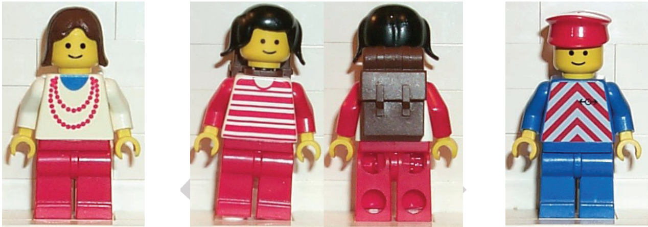
Algunas minifiguras del set 4554

El set contiene 8 minifiguras, que para el tamaño del set pueden parecer bastantes, pero no sobra ninguna. Hay que recordar que en aquellos años, las minifiguras tenían todas la misma cara, la carita sonriente. Por tanto el carácter y la personalidad venían dados por el torso y lo que les cubriese la cabeza. Esos eran buenos tiempos... Está el chef, que se encarga de la cafetería de la estación, tres pasajeros (el hombre del maletín, la chica de la mochila y la mujer del collar), y cuatro empleados de la estación (dos operarios con torso a rayas rojas, la dependienta de la venta de billetes y el jefe de estación).