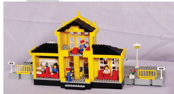
Trasera de la fachada

En 1996 LEGO® puso a la venta un set que era una versión de color rojo de esta estación (2150), pero no ha llegado al corazón de los aficionados como ha ocurrido con esta. La lástima de todo es que se trata de un set difícil de conseguir, y bastante caro en el mercado de segunda mano. En consecuencia es un set de los calificados como un "must have". Salvo que LEGO® realice una reedición, o un set similar con las técnicas actuales (ahí queda la petición...;-p) este será un set que permanecerá en el deseo de los aficionados.