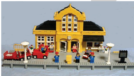
Frontal de la fachada

A pesar de la sencillez del montaje, el cual consiste, principalmente, en ir elevando el perímetro del edificio, hay detalles que engrandecen este set: los remates tan sencillos, pero muy estéticos de las cornisas de la estación, o las escaleras de acceso al primer piso, y más si se tiene en cuenta que la mayoría de sets de edificios de esa época no comunicaban unas plantas con otras. Sin menospreciar los detalles de las flores, el panel informativo o las farolas.