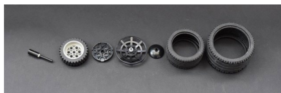
Partes de los neumáticos traseros

El modelo incluye muchas características, pero el interior es por mucho mi favorito.