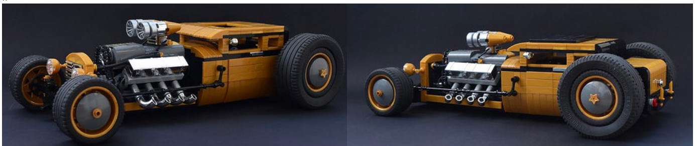
Pearl Gold Hotrod