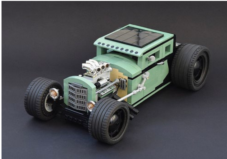
Sand Green Hotrod