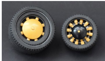
Ruedas Pearl Gold

Aunque el hotrod Pearl Gold tiene un aspecto similar al hotrod Sand Green, construí la carrocería dorada de forma muy distinta. Usé el bien conocido y probado método SNOT para construir los laterales y las puertas, pero aparte de este método es bastante similar al otro. Este coche dorado también se basa en el Ford Model 'A' de los años 30, pero con algunos detalles más extremos como su largo y la forma del techo, además del motor sobrealimentado, empleando nuevamente piezas de Model Team.