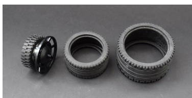
Partes de los neumáticos delanteros

Los motores de mis hotrods están inspirados y construidos como los sets de Model Team. En particular el LEGO® Blue Fury (5541) hotrod. El hotrod Sand Green tiene cuatro tubos curvos cromados del Model Team hotrod y el resto son custom. También llevo un tiempo construyendo mis propias ruedas con piezas en mis modelos (motos etc.) y lo mismo aplica aquí. Usé cinco elementos en las ruedas delanteras (sin contar las cubiertas) y ocho en las traseras (incluyendo dos cubiertas). He llegado todo lo cerca que quería.