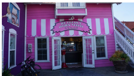
La tienda de helados en Shoreline Village