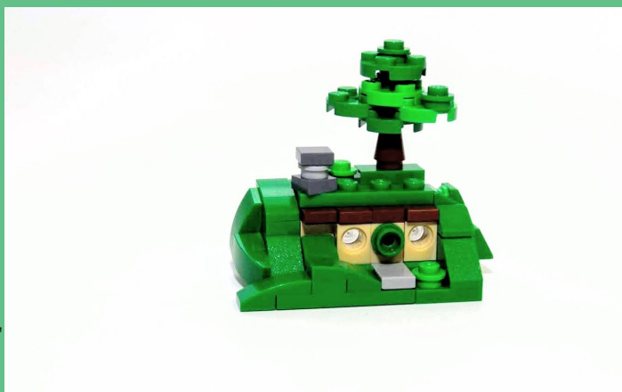
Micro Bag End (2018)

Este modelo que la gente de HispaBrick tuvo la amabilidad de compartir con ustedes es "Micro Bag End", o una recreación en microescala del humilde hobbit Hobbit de Bilbo / Frodo Baggins del Señor de los Anillos. Construí esta creación en 2018, en realidad a pedido de Brick Fanatics para su calendario anual de adviento.