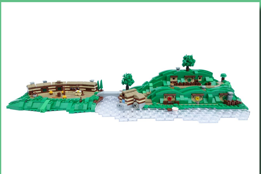
Hobbiton (Agosto 2017)

PB: El lanzamiento de la línea LEGO® Lord of the Rings en 2012 fue la razón principal por la que comencé a comprar sets de LEGO® nuevamente después de mis "dark ages". Al principio solo quería coleccionar los sets y las minifiguras, pero no estaba interesado en construir mis propias creaciones. Todo cambió en 2014, cuando quedó claro que LEGO® no lanzará más sets de El señor de los anillos y Hobbit. Debido al hecho de que tantos lugares de esa película / libro no se convirtieron en un set, decidí construirlos con mis propios ladrillos.