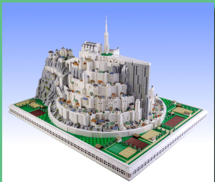
Minas Tirith (Junio 2018)

KZ: Cuando era niño jugaba mucho con LEGO® hasta que perdí el interés cuando cumplí 12 años. Vendí todos mis LEGO® (de los que aún me arrepiento) y me sumergí en las "Dark Ages". Después de graduarme, LEGO® volvió a llamar mi atención con el set 4195 La venganza de los piratas del Caribe de la reina Ana. Pensé que una gran nave como esta se vería genial como una pieza de exhibición en mi estantería. Mientras construía el barco, me sorprendió ver todos estos nuevos colores y formas que me entusiasmaron aún más. Como resultado, compré el resto de los sets de Pirates y pronto compré una partida de segunda mano de LEGO®. Fue entonces cuando comencé a construir MOCs. LEGO® es simplemente una excelente manera de desahogar mi creatividad.