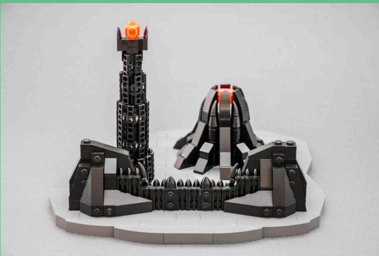
Mordor (Agosto 2017)

porque los nuevos son realmente caros para nosotros aquí.