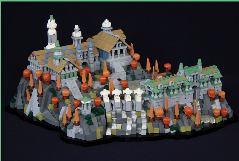
Rivendell (Agosto 2017)

Los increíbles modelos de fanáticos que se exhibieron allí me inspiraron, y desde entonces he estado involucrado activamente con la comunidad de LEGO® en línea y haciendo modelos originales.