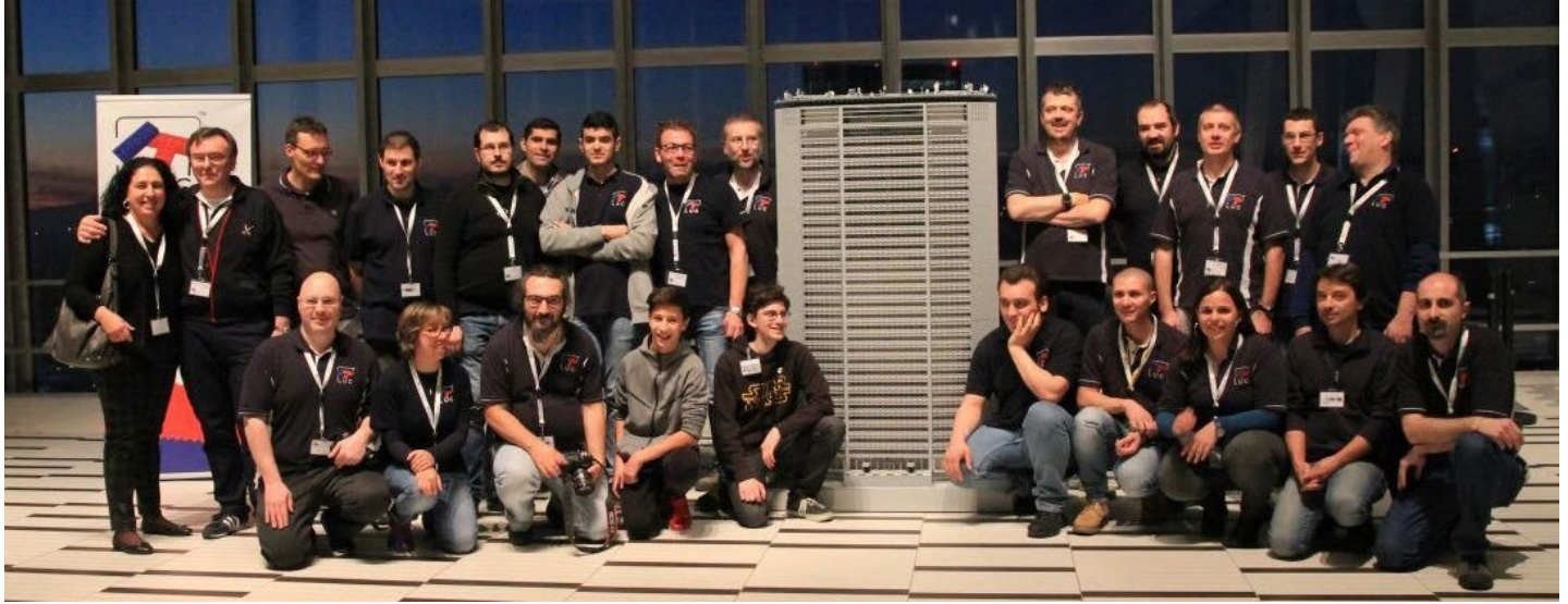
Miembros de ItLUG alrededor de "Il Pirellone", un proyecto del LUG.

miembros regulares. Por supuesto, no todas estas 450 personas están activas, pero muchas de ellas lo están. Algunos organizan eventos, algunos participan en eventos, algunos escriben en el foro y algunos ayudan de otras formas. Tenemos la intención de seguir organizando eventos (bueno, después de COVID-19) y promocionando el ladrillo LEGO de cualquier forma que podamos.