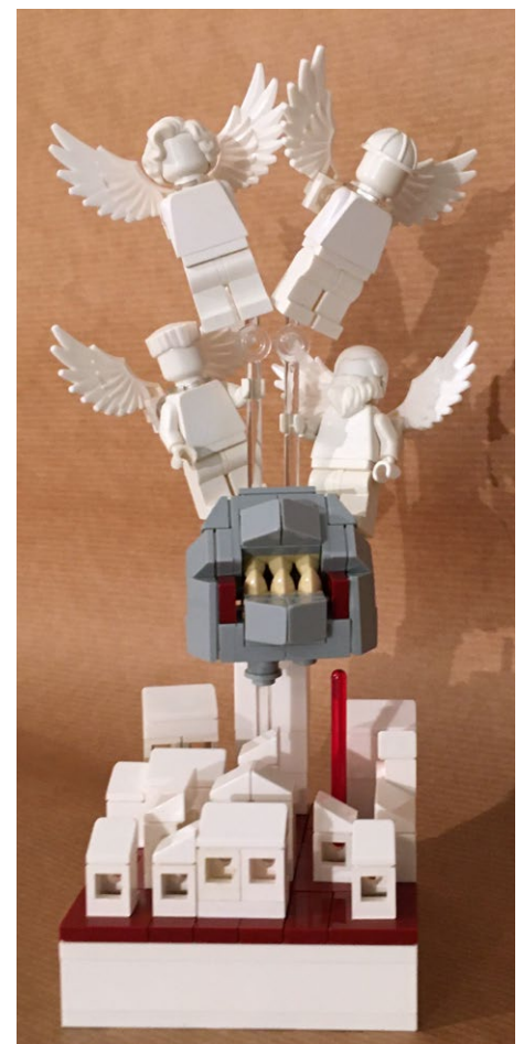
"Virus", por vedosololeg0

menudo voy a Billund (excepto este año) y puedo hablar con todo el mundo en persona, por lo que entiendo los LUG que se basan en lugares lejanos y no pueden hacer eso y me pierdo el aspecto personal de la relación ( la LAN es genial, pero nada mejor que reunirse en persona). No estoy seguro de que se pueda hacer algo al respecto... ¡excepto que el equipo de participación de AFOL viaja más por todo el mundo! Por el momento no tenemos ningún tipo de relación con LEGO Italia... esto estaba a punto de cambiar, estaba a punto de suceder una reunión, cuando el COVID-19 golpeó (de nuevo). Así que ahora todo está suspendido allí también".