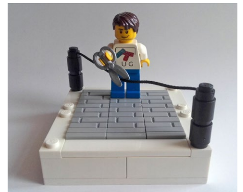
"Io taglierei la corda"