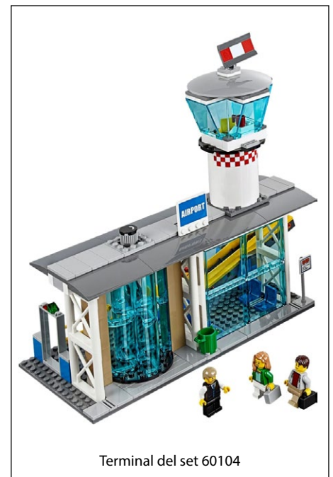
Terminal del set 60104