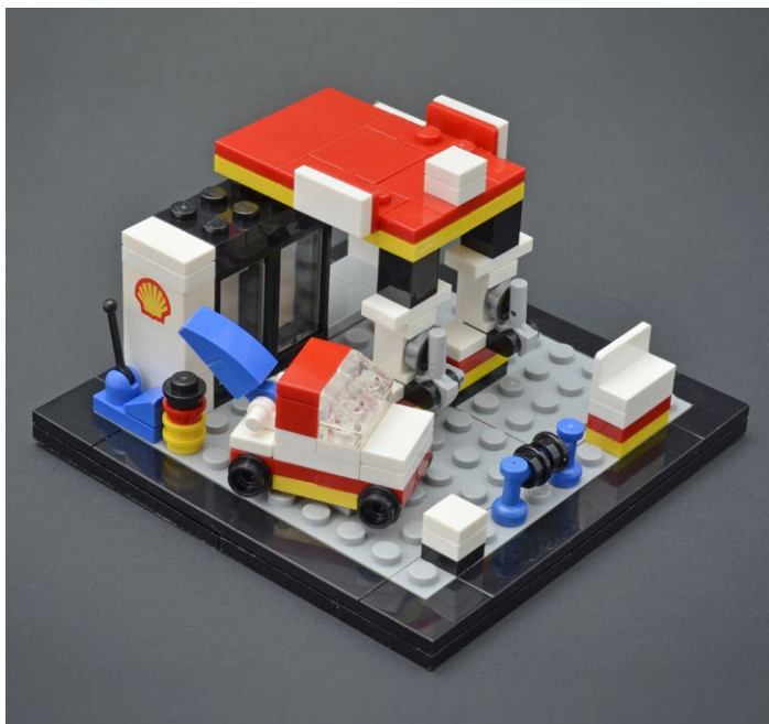
Jme Wheeler (AKA: Klikstyle), USA

https://www.flickr.com/photos/klikstyle/