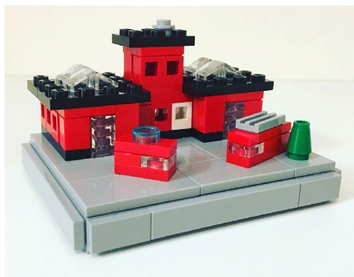
Olle Goto (AKA: le_goto), Suecia

https://www.flickr.com/photos/53719076@N05/