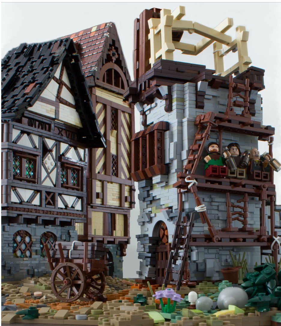
Left: My first MOC. Top: The future is bright. Above: The Wood Triptychon—The Tower

HBM: ¡Hola Ralf! Es un honor poder tener una entrevista con un constructor de LEGO tan técnico y detallado, y esperamos aprender más sobre tu gran trabajo. Pero primero, ¿podrías contarnos un poco sobre ti?