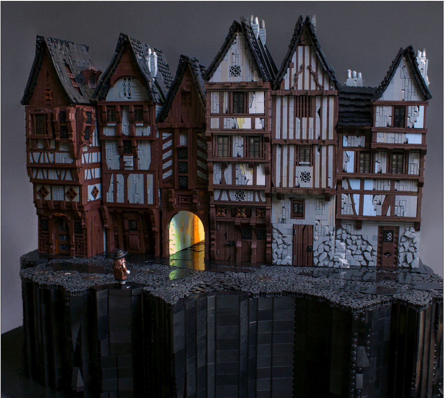
Superior: A Light in the Dark. Inferior: Black world with a pink twist. P103: Magnum Opus Fachwerkus

Lo más importante es que todavía estoy haciendo construcciones grandes e intrincadas.