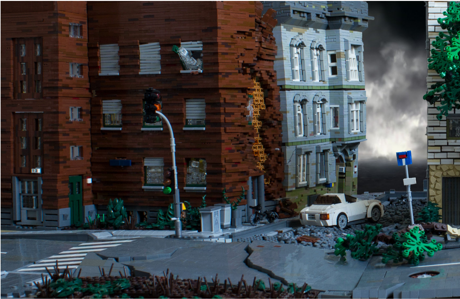
Superior: Broken Home. Derecha: Fishing in muddy waters. P101, inferior: Arrr.

No uso piezas de sets para construir MOCs. Empecé a crear una colección desde cero y me llevó años poder empezar.